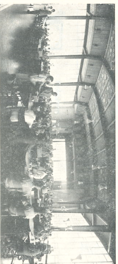
Onze kantine, zoals een fotograaf haar nog nooit gezien heeft, namelijk een opname welke werd vervaardigd met een Panox 140° supergroothoekcamera.